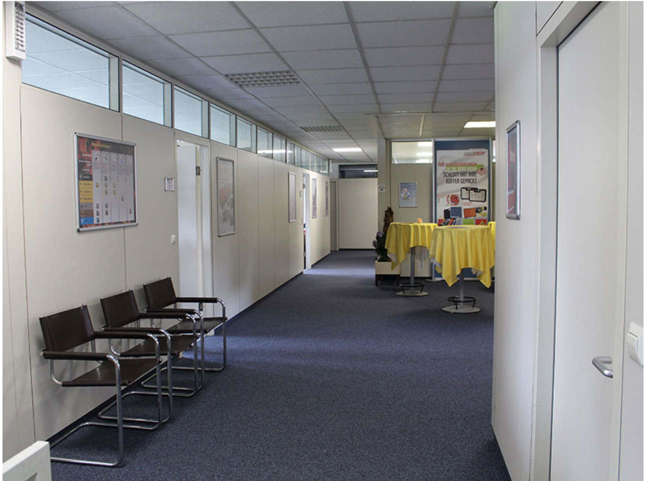
• Die Büroräumlichkeiten