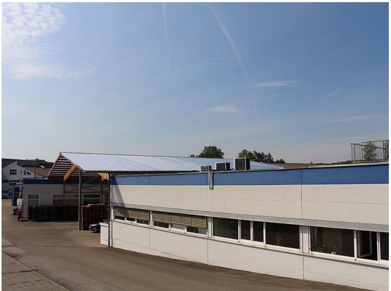
• Unser Gelände