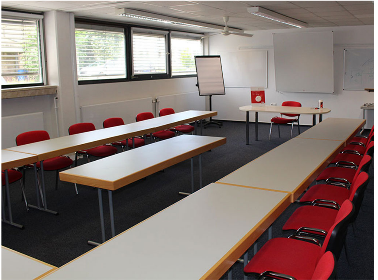
• Unser Schulungsbereich