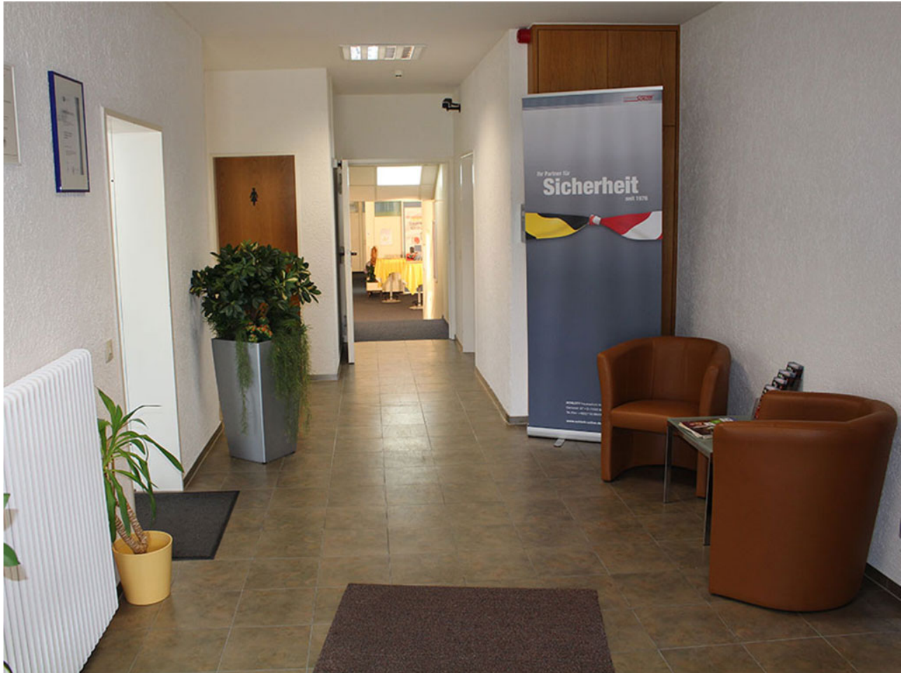
• Unser Geschäftsräume