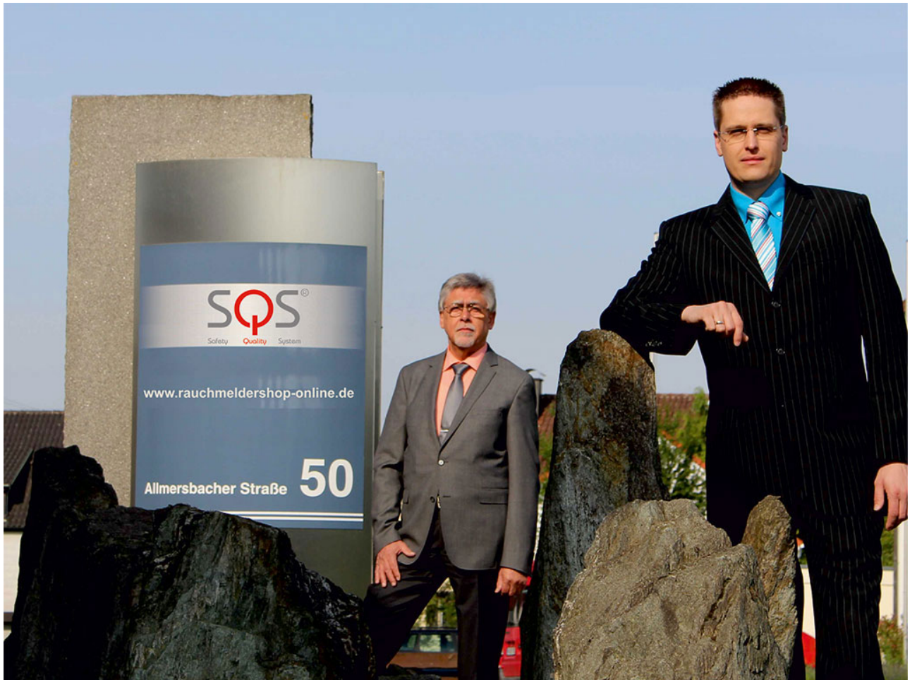
• Die Gründer